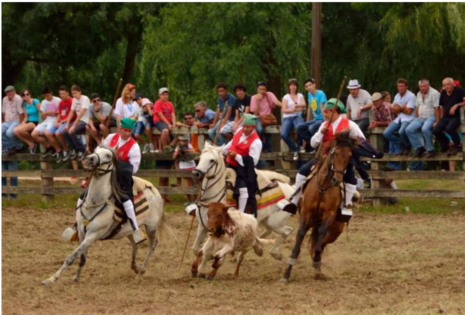
PICARIA DE BENAVENTE