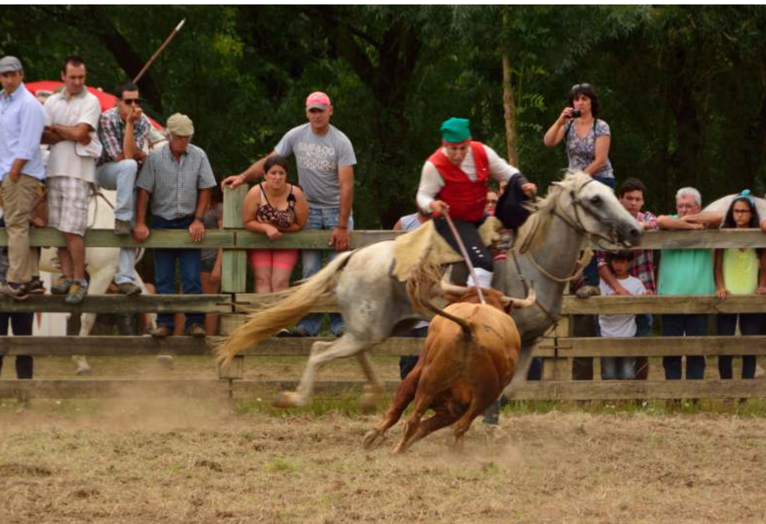
PICARIA DE BENAVENTE