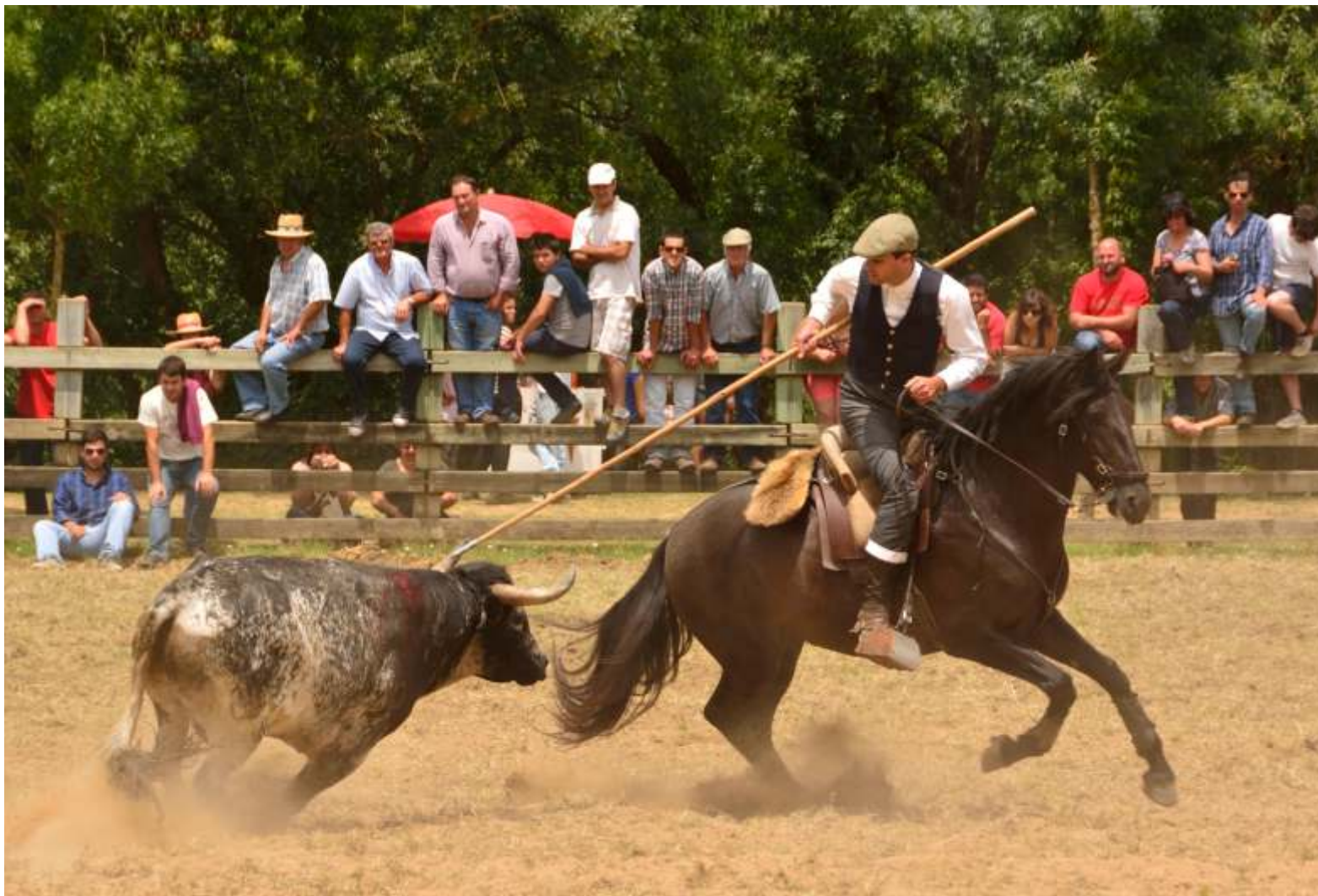
PICARIA DE BENAVENTE