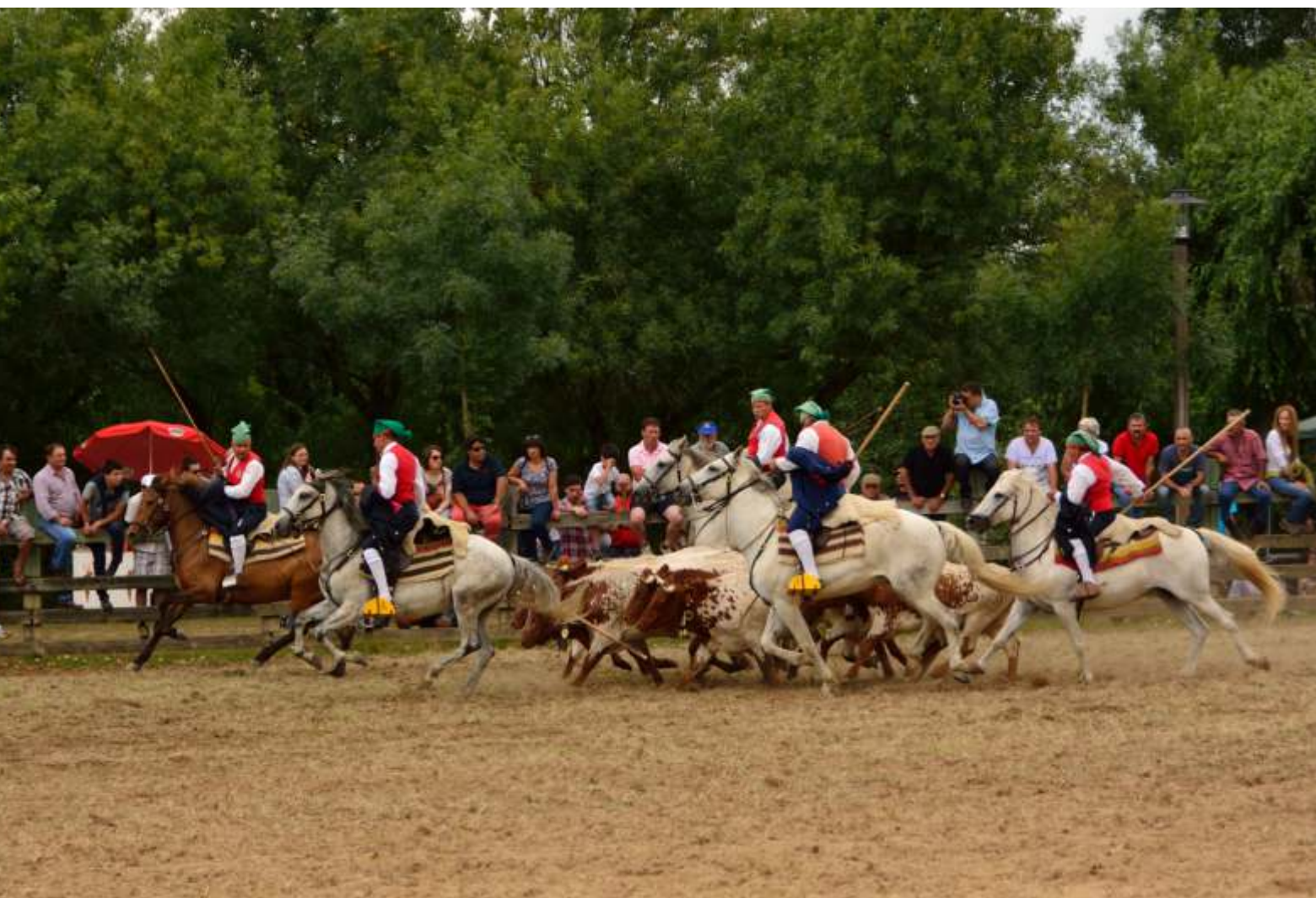
PICARIA DE BENAVENTE