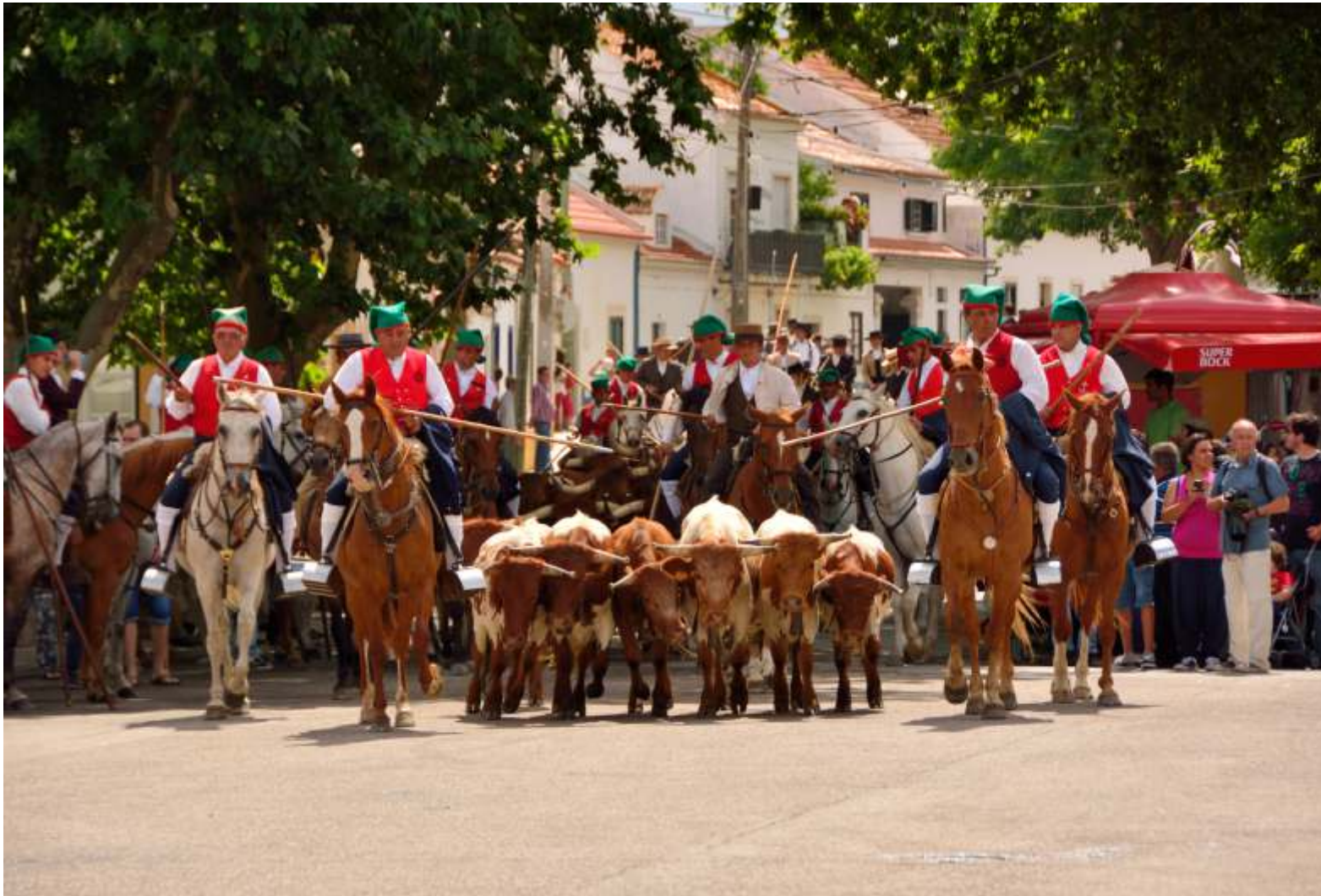
PICARIA DE BENAVENTE