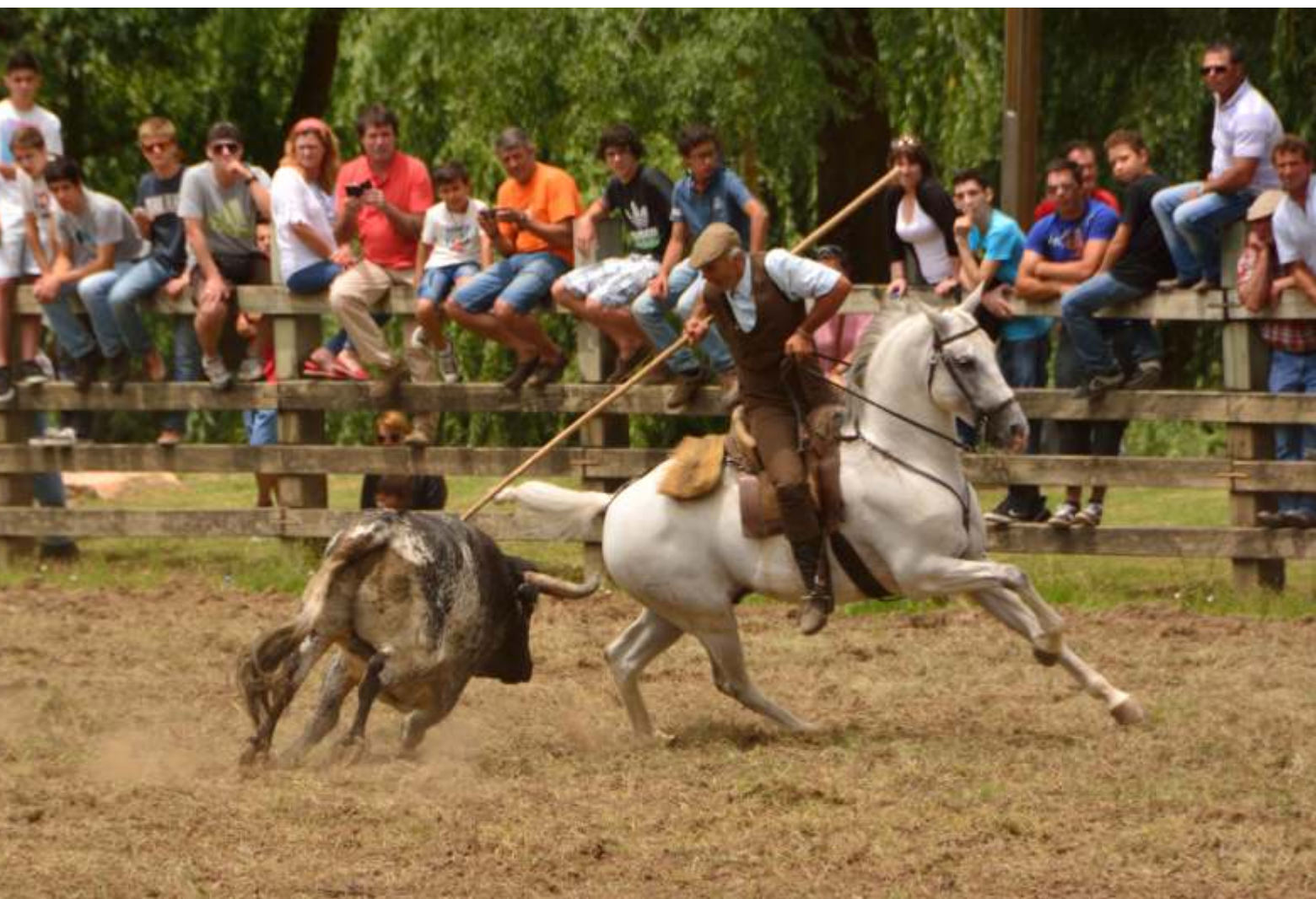
PICARIA DE BENAVENTE