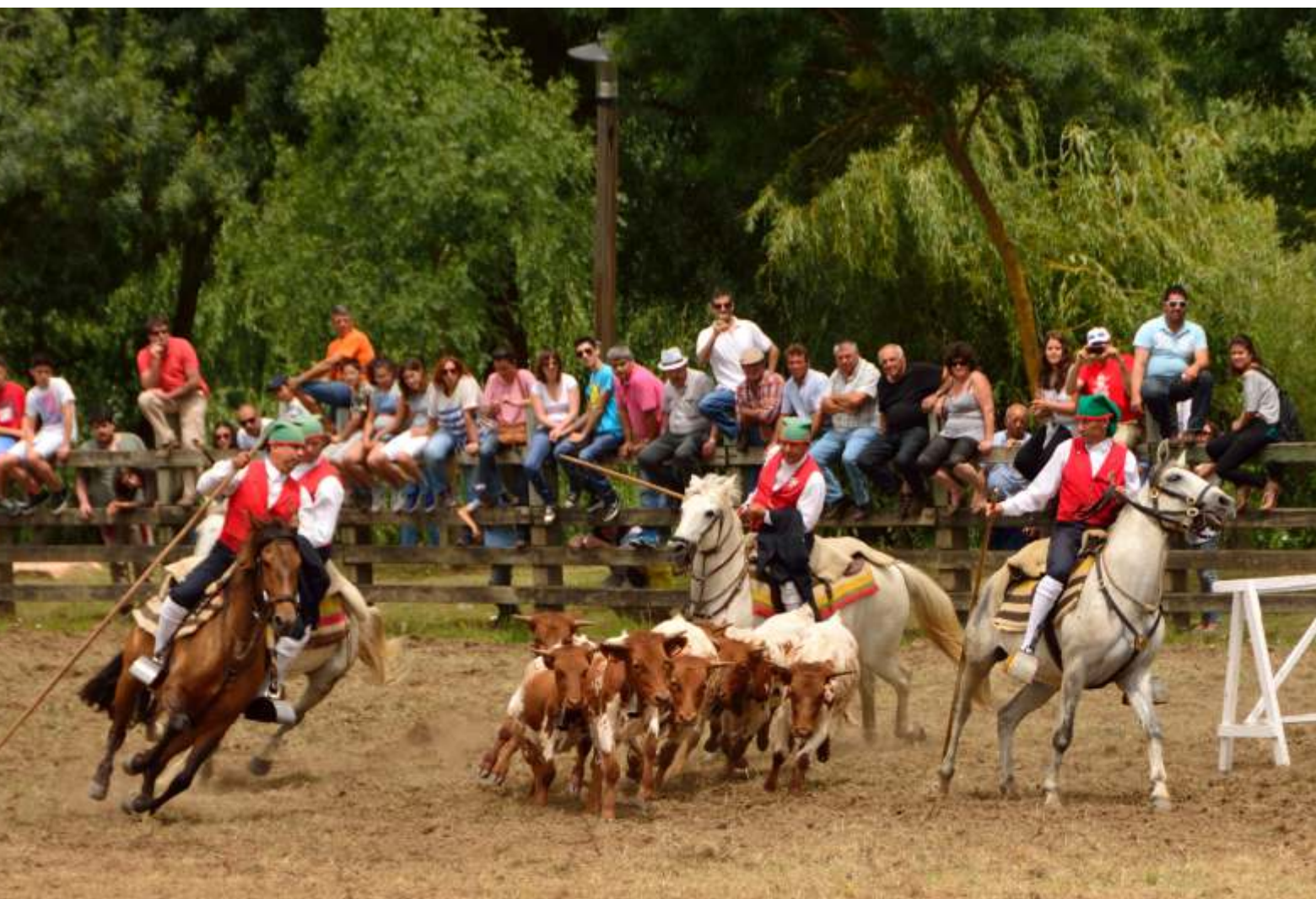
PICARIA DE BENAVENTE