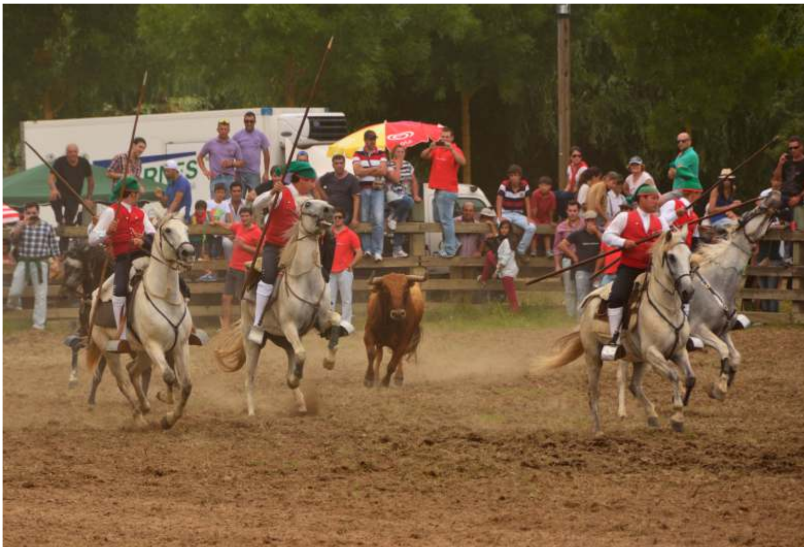
PICARIA DE BENAVENTE