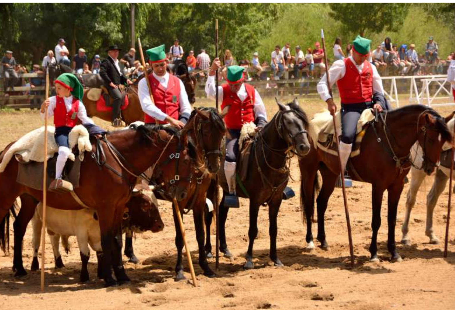
PICARIA DE BENAVENTE