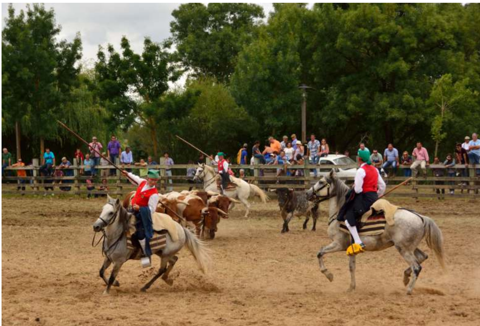
PICARIA DE BENAVENTE