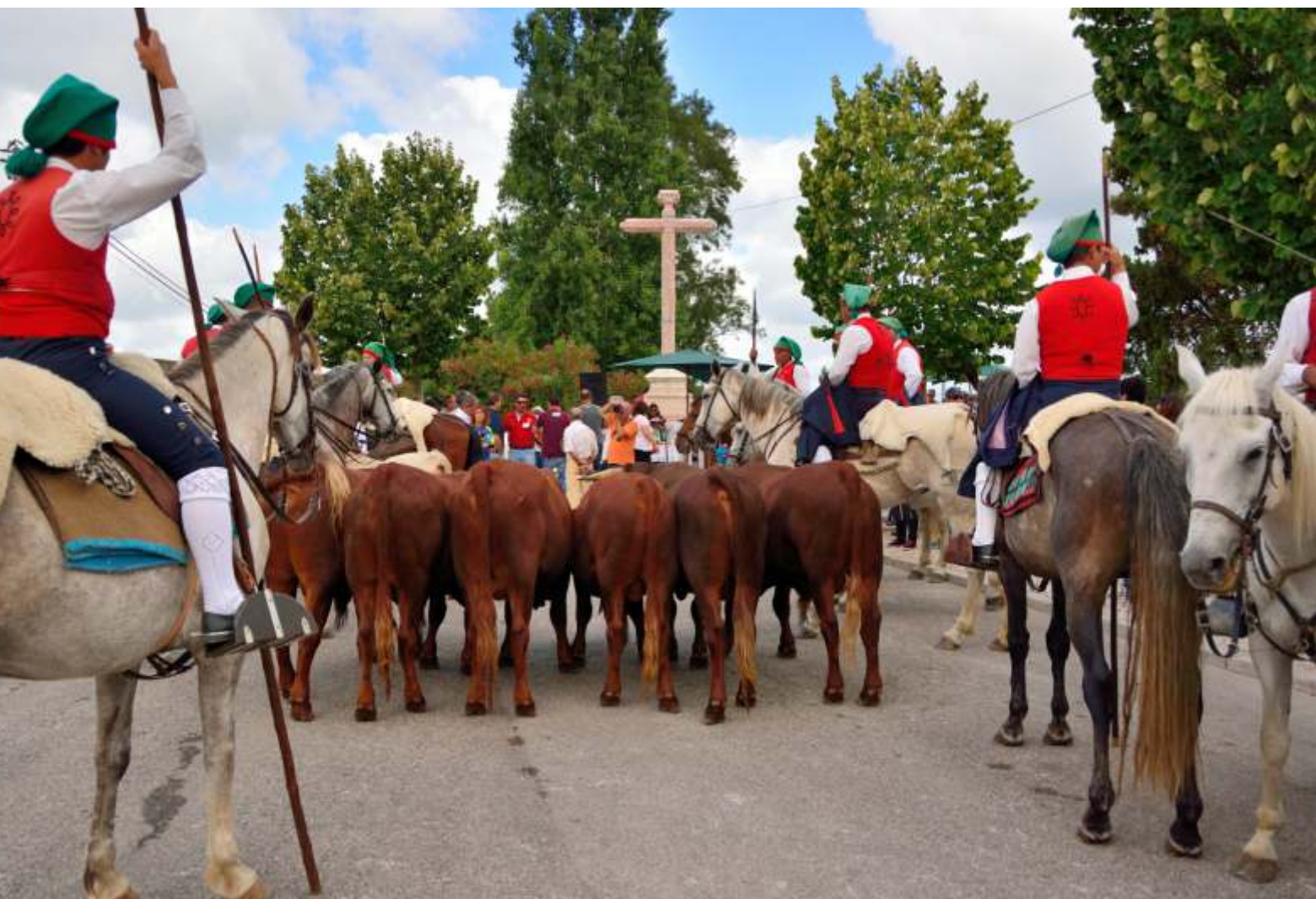
PICARIA DE BENAVENTE