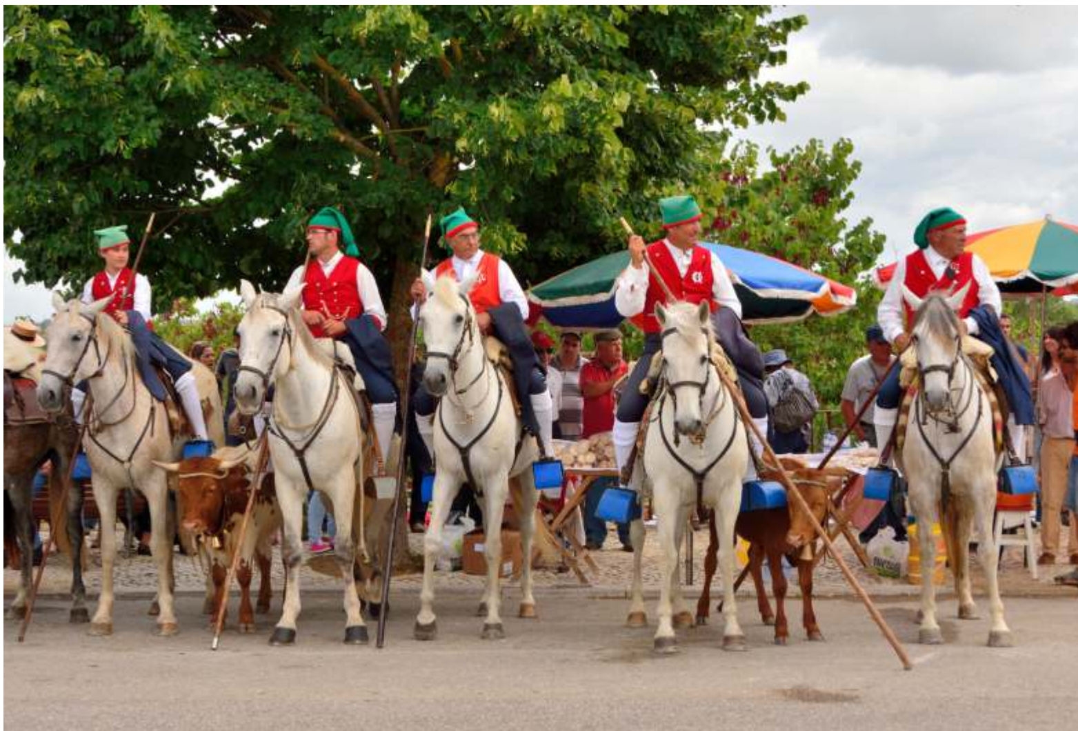
PICARIA DE BENAVENTE